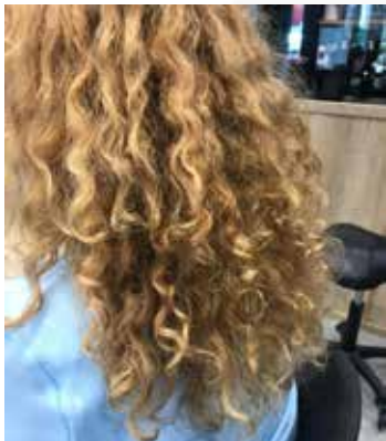
Verzorgde krullen dankzij Controlled Chaos